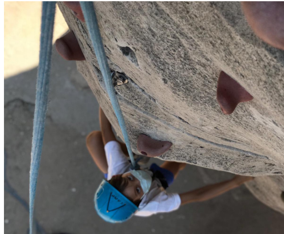
Escalada en rocódromo